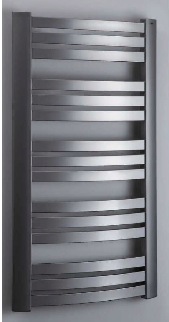
Q-616, Q-611, Q-608